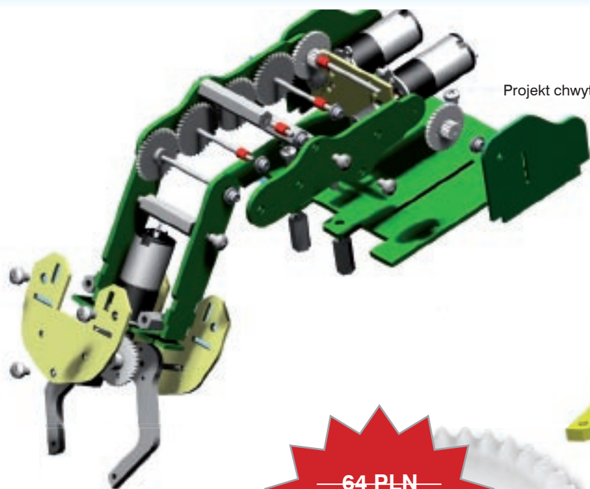
Projekt chwytaka do robota MAOR-12