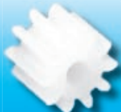
zębatka pojedyncza bez piasty